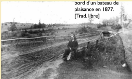
St. Peter's Head.

" À l'approche de Mount Stewart, les passagers pouvaient parfois connaître l'excitant défi d'une course avec un train, ce qui constituait une petite faveur supplémentaire. " - écrit par un journaliste à bord d'un bateau de plaisance en 1877. [Trad. libre]