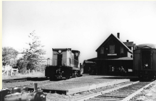
Mount Stewart train station.