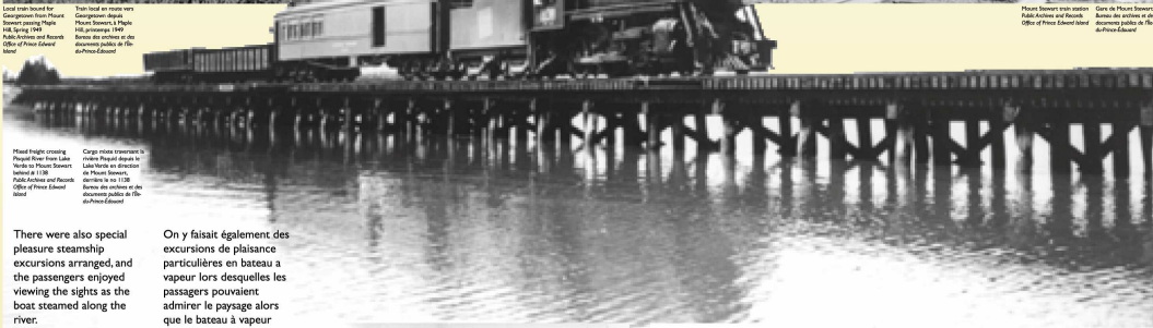
Head freight crossing Mount River near Lake Nereby at Mount Stewart, 1939.