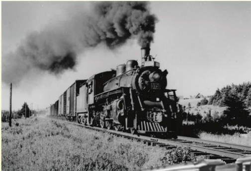
Load train bound for Georgetown from Mount Stewart, August 1949.

▲ La gare ferroviaire de Mount Stewart se trouvait autrefois à l'endroit où vous vous trouvez. Vous voyez ici l'une des deux fenêtres originales de la gare ayant servi à émettre les billets de passage. Il y avait une fenêtre pour les hommes et une pour les femmes.