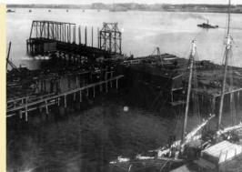
Building Hillsborough Bridge in 1906.

Peu à peu, l'émergence des trains et des routes a mis fin à l'occupation affairée de la rivière à titre de voie de communication privilégiée.