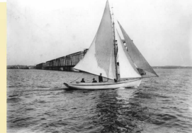
Sailing upriver, c. 1904. Public Archives and Records Office of Prince Edward Island